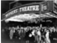
סוף סוף סאונד בקולנוע - 1926