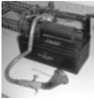
ה'אוזניות' הראשונות בדייקטפון.