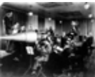
הקלטת תזמורת ב'ויקטור'