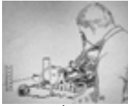
גרמפון של טיינבר - 1885