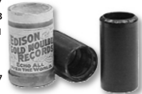
הצילינדרים הראשונים של אדיסון.